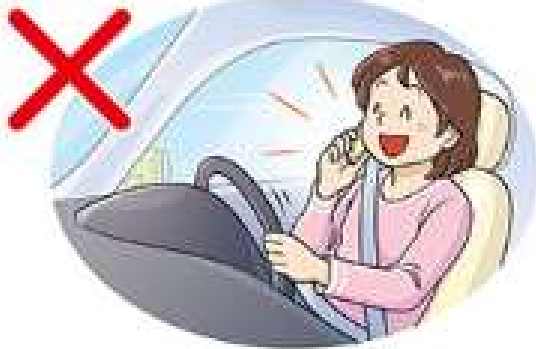
携帯電話を持って通話する (通話)