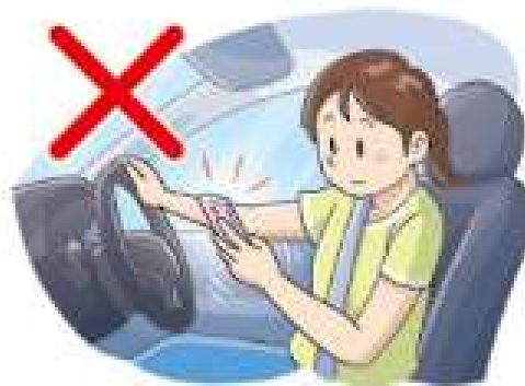
携帯電話の画面を注視する (画像注視)