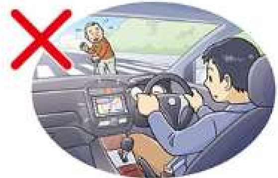
カーナビの画面を注視する (画像注視)

「スマホを見たり操作したりするといっても、ほんの一瞬なら大丈夫」と考えているなら、それは大きな間違いです。わずかな時間でもスマホに気を取られ、前方の安全確認がおろそかになって、 悲惨な交通事故につながる危険 があります。